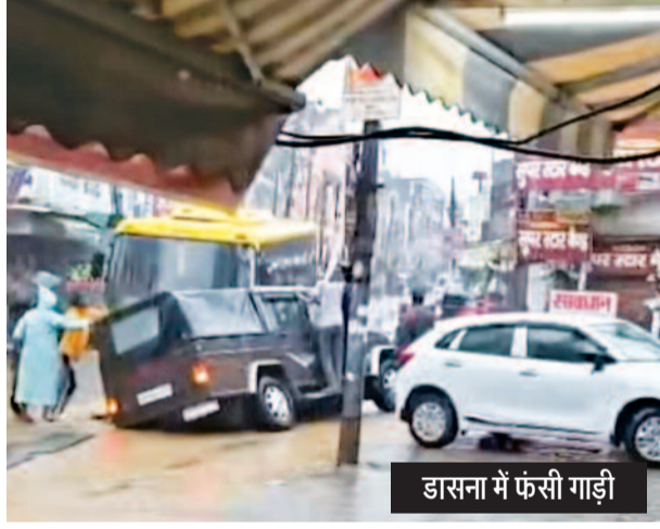
डासना में फंसी गाड़ी

कराने, क्षतिग्रस्त सड़कों की मरम्मत कराने तथा भविष्य में ऐसी स्थिति से बचने के लिए स्थायी समाधान करने की मांग की है।