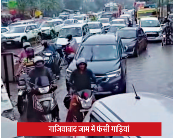
गाजियाबाद जाम में फंसी गाड़ियां

सावधानी बरतें। पानी से ढकी सड़कों पर गड्ढों का अनुमान लगाना कठिन होता है, जिससे दुर्घटना होने की आशंका बनी रहती है। साथ ही लोगों