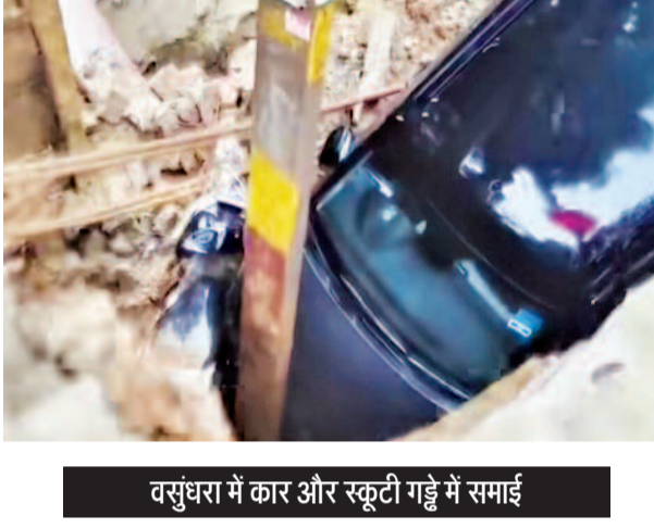
वसुंधरा में कार और स्कूटी गड्ढे में समाई