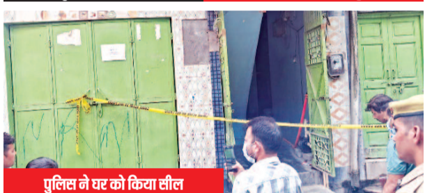
पुलिस ने घर को किया सील