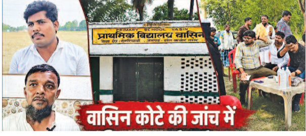
वासिन कोटे की जांच में