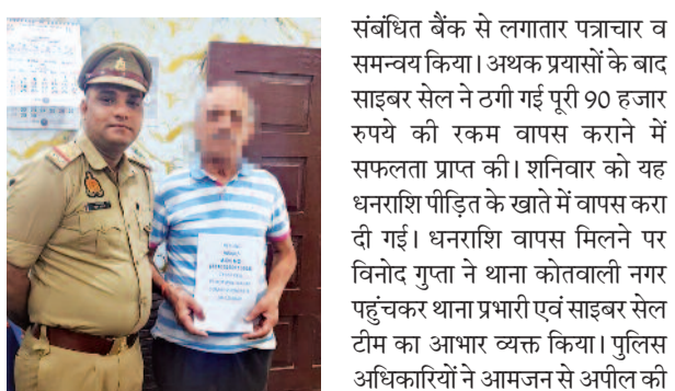
टीम ने तत्काल कार्रवाई शुरू की और

गाजियाबाद (वेलकम इंडिया)। थाना कोतवाली नगर की साइबर सेल ने त्वरित कार्रवाई करते हुए साइबर ठगी का शिकार हुए एक व्यक्ति की 90 हजार रुपये की धनराशि वापस कराकर बड़ी सफलता हासिल की है। यह कार्रवाई साइबर अपराधियों के खिलाफ चलाए जा रहे अभियान के तहत की गई।