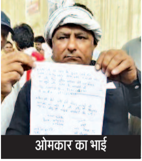
ओमकार का भाई