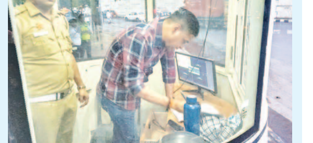
लोगों को कम से कम असुविधा हो और यातायात प्रभावित न हो।

यातायात को सुरक्षित, व्यवस्थित और निर्बाध बनाए रखने के लिए एडीसीपी ने दिल्ली मेट्रो के अधिकारियों के साथ बैठक कर समन्वय स्थापित करने पर जोर दिया, ताकि निर्माण कार्यों के दौरान आम