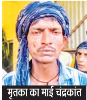
मृतका का माई चंद्रकांत