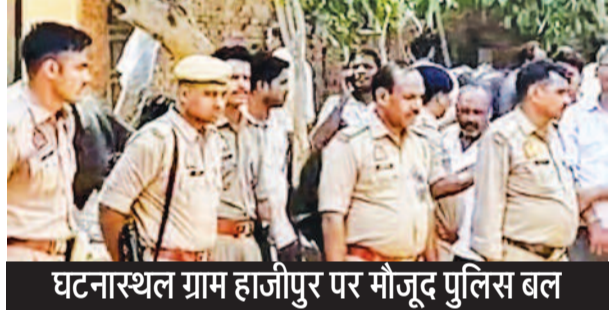
घटनास्थल ग्राम हाजीपुर पर मौजूद पुलिस बल