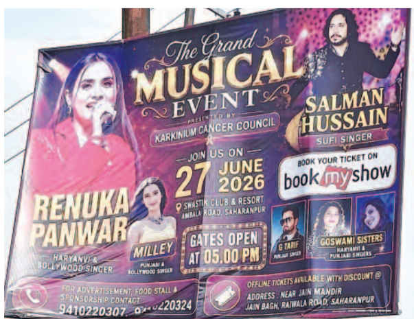
कि आखिर इतनी बड़ी संख्या के लिए पुलिस बल, फायर की गाड़ियां, निगम की परमिशन, यहां तक कि जीएसटी विभाग में पंजीयन भी आवश्यक है।