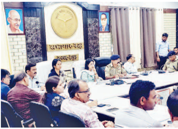
दवाएं उपलब्ध रहें। अधिशाली अभियंता विद्युत को निर्देश दिए कि कावड़ मार्ग पर लटकते/जर्जर तारों को तत्काल ठीक करें। विद्युत के सभी खंभों पर अस्थाई काली पोलिथिन की

अधिशाली अभियंता जल निगम एवं मुख्य चिकित्सा अधिकारी को निर्देश दिए कि मार्ग में प्रत्येक 1 किमी पर शुद्ध पेयजल, ओ आर एस घोल एवं स्वास्थ शिविर लगाए जाएं। सभी सी एच सी/पी एच सी व जिला अस्पताल में इमरजेंसी सेवाएं, एंटी-वेनम, एंटी-रेबीज एवं जीवन रक्षक