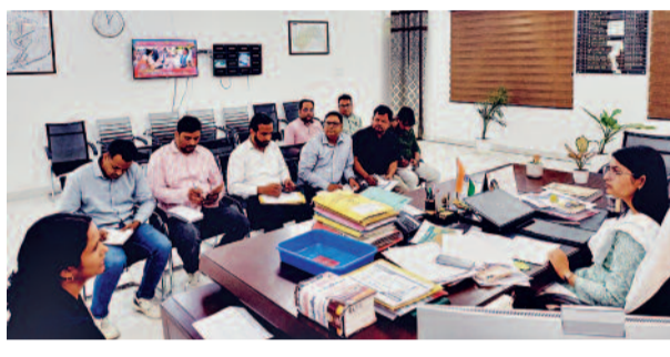
में गुणवत्ता के साथ पूर्ण कराना सुनिश्चित करें। कार्य की गुणवत्ता का थर्ड पार्टी निरीक्षण अनिवार्य है। घंटिया सामग्री मिलने पर टेकेदार व जे.ओ.ए. 0ई.0 के विरुद्ध कार्रवाई होगी। जिलाधिकारी ने कहा कि जिन योजनाओं में कार्य पूर्ण हो चुका है, उन्हें ग्राम पंचायत को तत्काल हैंडओवर कर संचालन शुरू कराया जाए। जलापूर्ति नियमित हो और पानी की जांच एफटीके (FTK) फिट से हर माह की जाए। ऑपरटर

अधिशाली अभियंता जल निगम को निर्देश दिए कि शत-प्रतिशत चरों तक नल से जल पहुंचाने का कार्य मिशन मोड में पूर्ण करें। कोई भी ग्राम/मजरा पेयजल योजना से वंचित न रहे। जिलाधिकारी ने स्पष्ट निर्देश दिए कि सभी निमाणाधीन ओवरहेड टैंक, पाइपलाइन, पंप हाउस एवं सोलर प्लांट का कार्य निर्धारित समय-सीमा