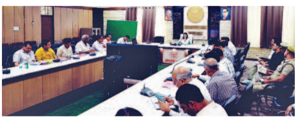
संभागीय परिवहन अधिकारी को निर्देश दिए कि शहर में ऑटो/ई-रिक्शा के रूट निर्धारित करें। बिना परमिट, बिना लाइसेंस एवं नवालिग चालकों के विरुद्ध कार्रवाई हो। सभी व्यावसायिक वाहनों पर स्पीड गवर्नर एवं जी पी एस लगवाना सुनिश्चित करें। पुलिस विभाग को सभी दुर्घटनाओं की एंटी-IRAD पोर्टल पर तत्काल करने के निर्देश दिए ताकि कार्रवाही का वैज्ञानिक विश्लेषण कर निवारण हो सके। सड़क सुरक्षा सबकी साक्षात् ज़िम्मेदारी है। यातायात नियमों का पालन करें, हेलमेट-सीटबेल्ट अवश्य लगाएं। तेज गति से वाहन न चलाएं।

जिलाधिकारी ने गत माह में हुई सड़क दुर्घटनाओं, मृत्यु एवं घायलों के आंकड़ों की समीक्षा की। पुलिस एवं परिवहन विभाग को 'ब्लैक स्पॉट' - जहां बार-बार दुर्घटना होती है - का चिन्हकरण कर, 15 दिन में सुधारात्मक कार्य पूर्ण करने के निर्देश दिए। जिलाधिकारी ने निर्देश दिए कि ओवरस्प्रीडिंग, शराब पीकर वाहन चलाना, बिना हेलमेट/सीटबेल्ट, गलत दिशा में वाहन चलाने एवं ओवरलॉडिंग के विरुद्ध सघन चेकिंग अभियान चलाया जाए। स्कूल वाहनों की फिटनेस एवं चालकों का पुलिस वेरिफिकेशन अनिवार्य किया जाए। जिलाधिकारी ने लोक निर्माण विभाग, एनएचएआई एवं नगर पालिका को निर्देश दिए कि सभी सड़कों पर संकेतक बोर्ड, रम्बल स्ट्रिप रैंप, कैट आई, क्रैश बैरियर एवं सोलर ब्लिंकर लगाए जाएं। सड़कों के गड्ढे 7 दिन में भरें। अतिक्रमण हटाकर फुटपाथ खाली कराएं। उन्होंने निर्देश दिए कि 'गोल्डन आवर' में घायलों को तत्काल इलाज मिले। सभी एंबुलेंस, ट्रॉफा सेंटर एवं CHC/PHC पर जीवनरक्षक दवाएं 24x7 उपलब्ध रहें। सहायक