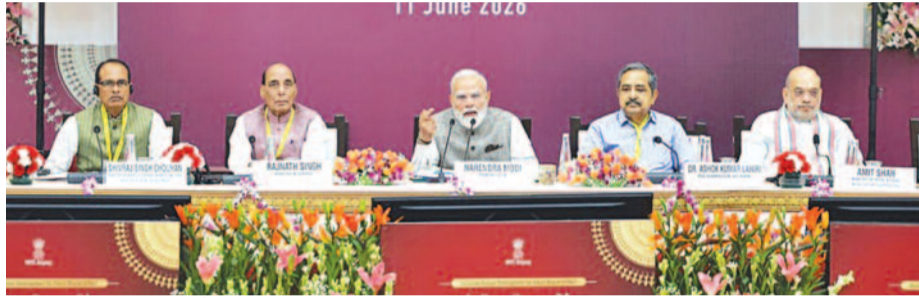
विकसित भारत और समावेशी विकास पर जोर

बैठक के बाद प्रधानमंत्री मोदी ने कहा कि केंद्र और राज्य मिलकर सहकारी संघवाद की भावना से देश के विकास को आगे बढ़ा रहे हैं। उन्होंने कहा कि 'विकसित भारत' के लक्ष्य को पूरा करने में सभी का साथ और सहयोग बहुत जरूरी है। उन्होंने सोशल मीडिया प्लेटफॉर्म 'एक्स' पर भी लिखा कि सभी मिलकर भारत की विकास यात्रा को तेज करने के लिए काम कर रहे हैं।