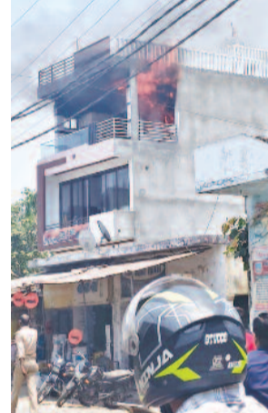
विभाग की टीम तत्काल मौके पर पहुंची। दमकल कर्मियों ने कड़ी मशक्कत के बाद आग पर काबू पाया और राहत एवं बचाव कार्य चलाया। पुलिस ने भी लोगों को सुरक्षित दूरी पर रखते हुए स्थिति को नियंत्रित किया। प्रारंभिक

पीलीभीत। कस्बा बिलसंडा में मंगलवार दोपहर करीब 2 बजे शेखर जूता-चप्पल दुकान के गोदाम में अचानक भीषण आग लगने से अफरा-तफरी मच गई। आग की ऊंची लपटें और धुएँ का गुबार उठता देख आसपास के दुकानदारों एवं स्थानीय लोगों में हड़कंप मच गया। देखते ही देखते आग ने पूरे गोदाम को अपनी चपेट में ले लिया। प्रत्यक्षदर्शियों के अनुसार आग लगने के कुछ ही मिनटों में गोदाम में रखा जूता-चप्पल तथा अन्य सामान धू-धू कर जलने लगा। घटना की सूचना तत्काल पुलिस और अग्निशमन विभाग को दी गई। सूचना मिलते ही बड़ी संख्या में लोग मौके पर पहुंच गए, जिससे क्षेत्र में भारी भीड़ जमा हो गई। सूचना पर थाना बिलसंडा पुलिस और अग्निशमन