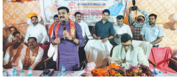
राज्यमंत्री ने कहा कि प्रधानमंत्री के सेवा, सुशासन और गरीब कल्याण के 12 वर्ष पूर्ण होने के उपलक्ष्य में 'सरकार आपके द्वार' अभियान चलाया