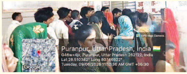
महिलाओं और बुजुर्गों को सबसे अधिक परेशानी झेलनी पड़ी। मरीजों का आरोप है कि भीड़ को नियंत्रित करने और व्यवस्थित पंजीकरण कराने के लिए पर्याप्त व्यवस्था नहीं की गई है। तस्वीर में साफ देखा जा सकता है कि एक ही खिड़की पर बड़ी संख्या में लोग जमा हैं, जिससे अव्यवस्था का माहौल बना हुआ है।

पीलीभीत/पूरनपुर। सामुदायिक स्वास्थ्य केंद्र (सीएचसी) पूरनपुर में स्वास्थ्य सेवाओं की बढहाल तस्वीर सामने आई है। मंगलवार को पंजीकरण काउंटर पर मरीजों और तीमारदारों की भारी भीड़ उमड़ पड़ी, जिससे लोगों को घंटों इंतजार और धक्का-मुक्की का सामना करना पड़ा। भोषण गर्मी के बीच पुरुष, महिलाएं और छोटे बच्चे इलाज के लिए लाइन में खड़े दिखाई दिए। अस्पताल के पंजीकरण कक्ष के बाहर हालात ऐसे रहे कि लोगों को अपनी बारी के लिए एक-दूसरे के बीच जगह बनानी पड़ रही थी।