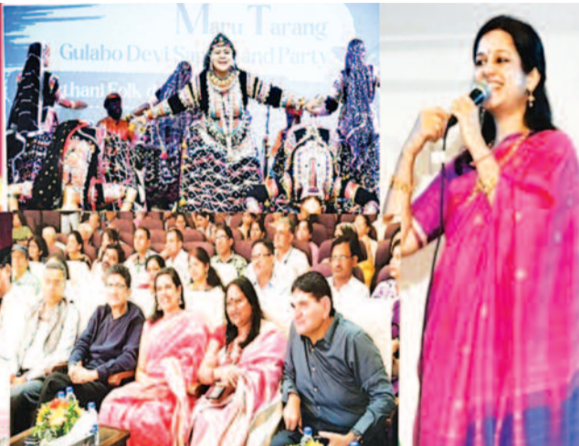
कविता की पंक्तियाँ सुनाई- 'वृक्ष, जितनी गहरी जड़ें होंगी, उतना तुम हरियाओगे।' सांस्कृतिक प्रस्तुतियों के अंतर्गत