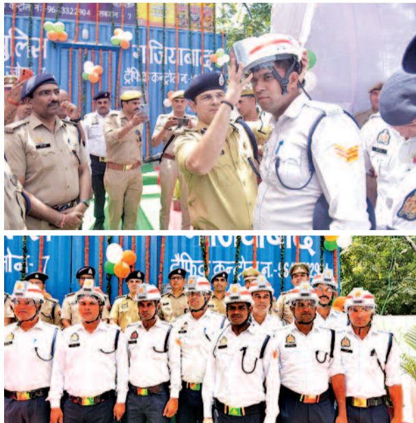
चौराहों पर ओआरएस और पानी

शहर में गर्मी ने पिछले कई सालों के रिकॉर्ड तोड़ दिए हैं। दोपहर में सड़क का तापमान 50 डिग्री के पार पहुंच रहा है। ऐसे में चौराहों पर 8-10 घंटे खड़े होकर ड्यूटी करने वाले ट्रैफिक पुलिसकर्मियों को हीट स्ट्रोक, डिहाइड्रेशन और चक्कर जैसी परेशानियों का सामना करना पड़ रहा था। कई जवानों की तबीयत भी बिगड़ चुकी थी।