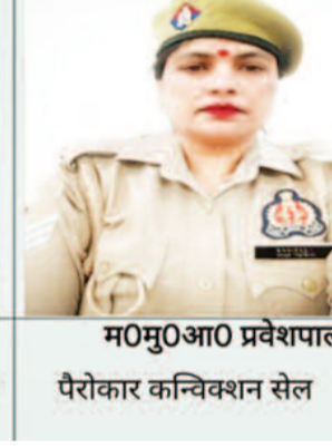
मओमुओआओ प्रवेशपाल पैरोकार कन्विकशन सेल