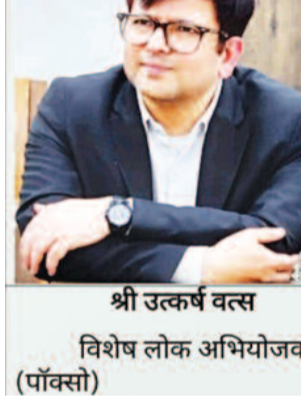
श्री उत्कर्ष वत्स विशेष लोक अभियोजक (पाँक्सो)