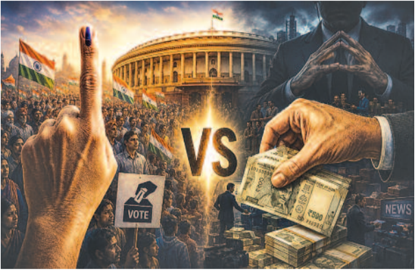
इतिहास इस बात का साक्ष्य है कि जब-जब जनता ने जागरूक होकर अपने

लोकतांत्रिक व्यवस्था की एक गहरी समस्या बन चुकी है। विकसित देशों में कॉर्पोरेट लाईबिंग और चुनावी फंडिंग के माध्यम से नीति निर्माण प्रभावित होता है, तो विकासशील देशों में सीधे तौर पर धनबल का प्रयोग मतदाताओं को प्रभावित करने के लिए किया जाता है। इस प्रकार लोकतंत्र, जो मूलतः जनता की इच्छाशक्ति का प्रतिबिंब होना चाहिए था, धीरे-धीरे संसाधनों के असमान वितरण का प्रतिबिंब बनता जा रहा है। परन्तु इस निराशाजनक परिदृश्य के बीच भी वोट की शक्ति को पूरी तरह कमतर आंकना एक गंभीर भूल होगा।