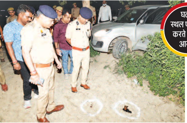
घटना स्थल पर जांच करते पुलिस आयुक्त

पुलिस जांच के दौरान 11.05.2026 को स्वाट टीम अपराध शाखा एवं थाना क्रासिंग रिपब्लिक पुलिस ने कार्रवाई करते हुए