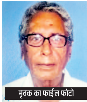
मृतक का फाईल फोटो

गाजियाबाद (वेलकम इंडिया)। थाना लोनी बॉर्डर क्षेत्र में हुई एक सनसनीखेज हत्या की घटना का पुलिस ने सफल अनारपण करते हुए दो अभियुक्तों को गिरफ्तार कर लिया है, जबकि घटना में शामिल एक किशोरी बाल अपचारी को पुलिस संरक्षण में लिया गया है। प्राप्त जानकारी के अनुसार, दिनांक 29 अप्रैल 2026 को वादी द्वारा थाना लोनी बॉर्डर में तहरीर दी गई थी कि अज्ञात व्यक्तियों ने उसके पिता के साथ मारपीट कर गला दबाकर उनकी हत्या कर दी। मामले की गंभीरता को देखते हुए पुलिस ने तत्काल धारा 103(1) बीएनएस के तहत मुकदमा दर्ज कर जांच शुरू की और विशेष टीमों का गठन किया। पुलिस टीम ने त्वरित कार्रवाई करते