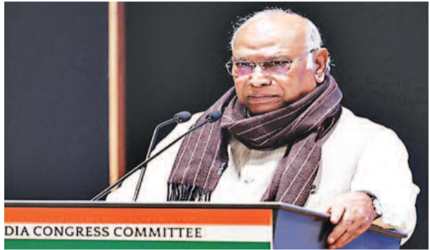
DIA CONGRESS COMMITTEE

और ये लोग उनके साथ जुड़ रहे हैं, इसका मतलब है कि वे लोकतंत्र को कमजोर कर रहे हैं। एआईएडीएमके-भाजपा गठबंधन पर उनका तीखा हमला तमिलनाडु चुनाव