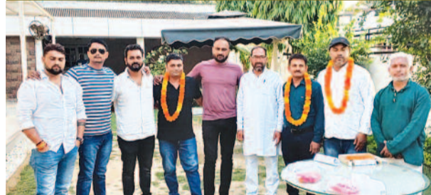
वेलकम इंडिया संवाददाता