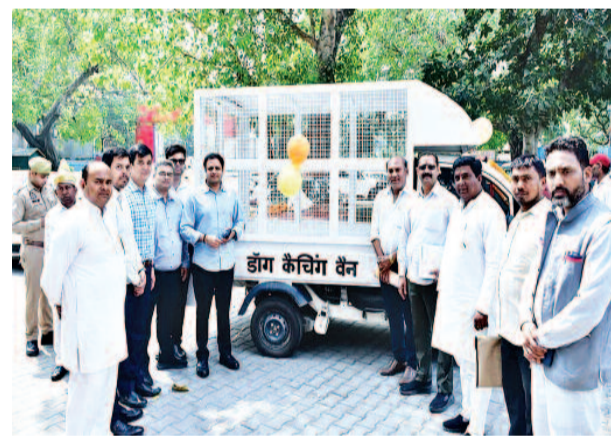
तेजाती की गई है, जिससे कुत्तों को बिना किसी नुकसान के सुरक्षित तरीके से पकड़ा जा सकेगा।

गाजियाबाद। शहर में बढ़ती आवारा कुत्तों की समस्या से निपटने के लिए गाजियाबाद नगर निगम ने एक महत्वपूर्ण और सराहनीय कदम उठाया है। आमजन की सुरक्षा और शहर में संतुलित वातावरण बनाए रखने के उद्देश्य से निगम ने अत्याधुनिक सुविधाओं से लैस नई डॉग कैचिंग वैन को शुरूआत की है। नगर आयुक्त विक्रमादित्य सिंह मलिक के निर्देशन में शुरू की गई इस पहल के तहत अब स्ट्रेट्स के रेस्क्यू और नियंत्रण कार्य को अधिक तेज, सुरक्षित और प्रभावी बनाया जाएगा। नई वैन में आधुनिक उपकरणों के साथ प्रशिक्षित स्टाफ की