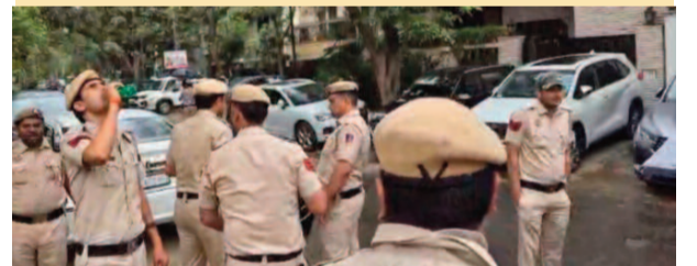
वेलकम इंडिया संवाददाता

दिल्ली। कांग्रेस नेता के दिल्ली स्थित आवास पर मंगलवार को असम पुलिस पहुंची, जिससे राजनीतिक हलकों में हलचल तेज हो गई। यह कार्रवाई असम के मुख्यमंत्री की पत्नी द्वारा दर्ज कराई गई ऋकम के बाद की गई है। दरअसल, पवन खेड़ा ने हाल ही में आरोप लगाया था कि मुख्यमंत्री की पत्नी के पास कथित तौर पर कई विदेशी पासपोर्ट और विदेशों में