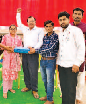
पर आकर्षक साफा पहने श्रावक, पुलिस बैण्ड, बालिका मण्डल की

बालिकाएं शामिल रही वहीं द्वितीय सिर में ढोल पार्टी, परमात्मा का पालणा का रथ, पदमावती बैण्ड, साध्वी-भगवन्त, मंगल कलशधारी माताएं-बहिन, महिला मण्डल की कार्यकर्ता व बड़ी संख्या में श्राविकाएं शामिल रही। वहीं अन्तिम सिर में जैन समाज के विभिन्न, संस्थाओं व ज्ञान पाठशाला द्वारा बनाई बहुत आकर्षक, ज्ञानबद्ध झाकिया शामिल रही। जुलूस के दौरान शहर भर में अलग ही माहौल रहा, पूरे प्रभु भक्ति में रम गया, अहिंसामय व करुणामय हो गया। रक्तदान शिविर, जीवदया