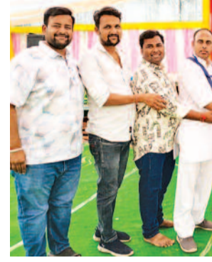
पिता का रथ, राजेन्द्र बैण्ड, साधु-भगवन्तों के बाद बड़ी संख्या में सिर