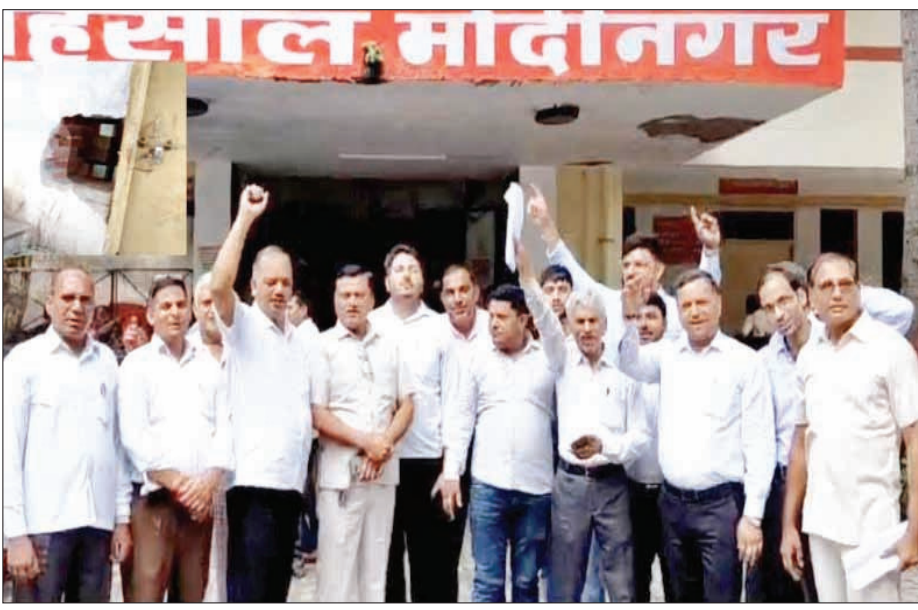
कार्यालय मौजूद है। वहां सोमवार की देर रात रजिस्ट्रार के कार्यालय में कुंभल कर चोरी की घटना हुई। चोरों ने ताले तोड़कर कार्यालय से