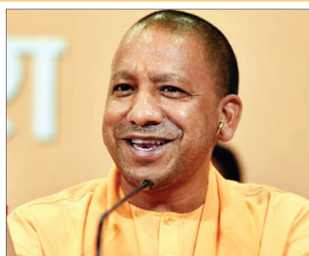
चुका है। सभी अनुमति मिलते ही निर्माण कार्य का शुभारंभ हो जाएगा। फिल्म सिटी का शिलान्यास मुख्यमंत्री

निर्माण कार्य के लिए बोनी कपूर की कंपनी बेव्यू प्रोजेक्ट्स एलएलपी ने पूरी तैयारी कर ली है। यमुना एक्सप्रेसवे पर इंटरनेशनल फिल्म सिटी का निर्माण अगले माह से शुरू हो सकता है। निर्माण कार्य के लिए बोनी कपूर की कंपनी बेव्यू प्रोजेक्ट्स एलएलपी ने पूरी तैयारी कर ली है। जिस भूमि पर निर्माण होना है उसका जियो-टेक्निकल सर्वे लगभग पूरा हो चुका है और कंपनी आने वाले दो-तीन दिनों में अपना बिल्डिंग प्लान दाखिल कर देगी। जमीन समतल करने का काम जारी है और सड़क निर्माण सहित अन्य विकास कार्य भी तेजी से हो रहे हैं। साफ-सफाई का काम लगभग पूरा हो