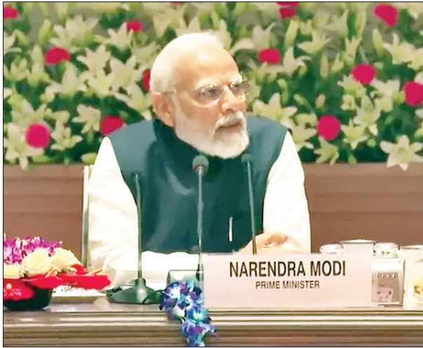
अधिकारी के अनुसार, बैठक में बजट 2025-26 में की गई पहलों और भारतीय अर्थव्यवस्था के सामने आने

प्रधानमंत्री नरेन्द्र मोदी शनिवार को दिल्ली में स्थित भारत मंडप में नीति आयोग की महत्वपूर्ण बैठक की अध्यक्षता करेंगे। भारतीय सशस्त्र बलों द्वारा पाकिस्तान और पीओके में 9 आतंकवादी ठिकानों को नष्ट करने के बाद प्रधानमंत्री और सभी राज्यों के मुख्यमंत्रियों के बीच यह पहली बड़ी वार्ता है। नीति आयोग के एक बयान के अनुसार, बैठक में विकसित भारत के लक्ष्य को प्राप्त करने के लिए सभी राज्यों के साथ 'टीम इंडिया' के रूप में काम करने की प्रधानमंत्री की प्रतिबद्धता को रेखांकित किया गया। बैठक में अर्थव्यवस्था पर फोकस इस बैठक का मुख्य उद्देश्य अर्थव्यवस्था पर फोकस करना होगा।