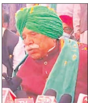
किसानों एवं नवयुवकों ने हिस्सा लिया।