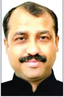
ललित शर्मा संपादक

कां कांगड़ा बस स्टैंड के अंधेरे कोने में छुपे सांप को एक लडकी की हिम्मत ने पकड़वा दिया, वरना यह डक पूरे समाज के लिए काफ़ी है। प्रश्न कानून व्यवस्था से जुड़ा है, लेकिन बस स्टैंड प्रबंधन की लचर व्यवस्था को भी कठपंटे में लाकर खड़ा किया है। आश्चर्य यह कि छेड़छाड़ की घटना के वक्त न तो पुलिस सुरक्षा के नंबर चले और न ही बस स्टैंड के कान खड़े हुए। बहरहाल, यह लडकी का साहस और समाज के साक्ष्यों का कमाल है कि बस स्टैंड में घूम रहे लफंगे को पकड़ लिया गया। इससे पहले पालमपुर बस स्टैंड में एक मनचले युवक ने दरार से सर्रेआम एक छात्रा पर हमला किया था। कन्हन को हिमाचल पर्यटकों को आदर सहित बुला रहा है, लेकिन रात के समय यात्रा करने के लिए अगर ऐसी वेगवानों ने, तो फिर प्रदेश की छवि का क्या होगा। प्रदेश की छवि के कई मलाल अब होने लगे हैं। मसलन बीबीएन में बनी दवाइयों की विश्वसनीयता घायल होने लगी है। नकली दवाइयों के कई अंधेरे अगर दवाई उत्पादन के उजालों को प्रभावित करेंगे, तो कौन हमारी क्षमता को परवान चढ़ाएगा। दरअसल हिमाचल नई सभावनाओं की प्रगति में अपने आकरण व चरित्र से बेकाबू होने लगा है।