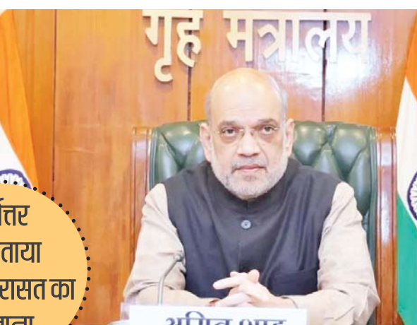
पूर्वोत्तर को बताया समृद्ध विरासत का खजाना

केंद्रीय गृह सहकारिता मंत्री अमित शाह के अनुसार पूर्वोत्तर और भारत एक-दूसरे के बिना अधूरे हैं। 'यूनिटी उत्सव: वन वॉयस, वन नेशन' पर आयोजित कार्यक्रम को संबोधित करते हुए शाह ने कहा कि 2027 तक पूर्वोत्तर भारत के सभी राज्य रेल और हवाई मार्ग से दिल्ली के साथ जुड़ जाएंगे। उन्होंने कहा कि पूर्वोत्तर में शांति की स्थापना के साथ ही संस्कृतिक विकास भी हो रहा है। भारत की ही तरह पूर्वोत्तर के राज्यों में सांस्कृतिक और भाषायी विविधता का उदाहरण देते हुए