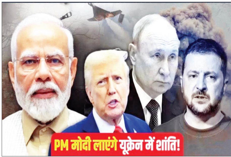
PM मोदी लाएंगे यूक्रेन में शांति!

इस दिन संयुक्त राष्ट्र मुख्यालय में शांति की घंटी बजाई जाती है, जो यह प्रतीक है कि जब तक धरती पर शांति नहीं होगी, तब तक जीवन सुरक्षित नहीं हो सकता। आज विज्ञान और तकनीक ने मानव को अभूतपूर्व शक्ति और संसाधन दिए हैं, लेकिन इसके साथ ही भय, हिंसा, तनाव और असुरक्षा भी बढ़ी है। परमाणु हथियारों की दौड़ ने धरती को विनाश के कगार पर ला खड़ा किया है। आर्थिक असमानताएं और संसाधनों की होड़ युद्धों और संघर्षों को जन्म दे रही हैं। जलवायु परिवर्तन और पर्यावरणीय संकट नए विवादों एवं संकटों को जन्म दे रहे हैं। इस पृष्ठभूमि में अंतर्राष्ट्रीय शांति दिवस केवल एक औपचारिक अवसर नहीं, बल्कि एक चेतावनी और आह्वान है। यह हमें सोचने पर मजबूर करता है कि क्या हम हिंसा और युद्ध की संस्कृति से ऊपर उठकर शांति, संवाद और सहयोग की संस्कृति को स्थापित कर सकते हैं, क्या हम धर्म, जाति और राजनीति की संकीर्णताओं से निकलकर एक वैश्विक परिवार के रूप में जी सकते हैं, क्या हम शिक्षा, करुणा और अहिंसा को अपने जीवन और समाज का आधार बना सकते हैं। विश्व शांति की दिशा में भारत का योगदान हमेशा से उल्लेखनीय रहा है और वर्तमान समय में प्रधानमंत्री नरेंद्र मोदी ने इसे नई दिशा और ऊर्जा प्रदान की है। उन्होंने अंतरराष्ट्रीय मंचों पर बार-बार वसुधैव कुटुम्बकम् और एक पृथ्वी, एक परिवार, एक