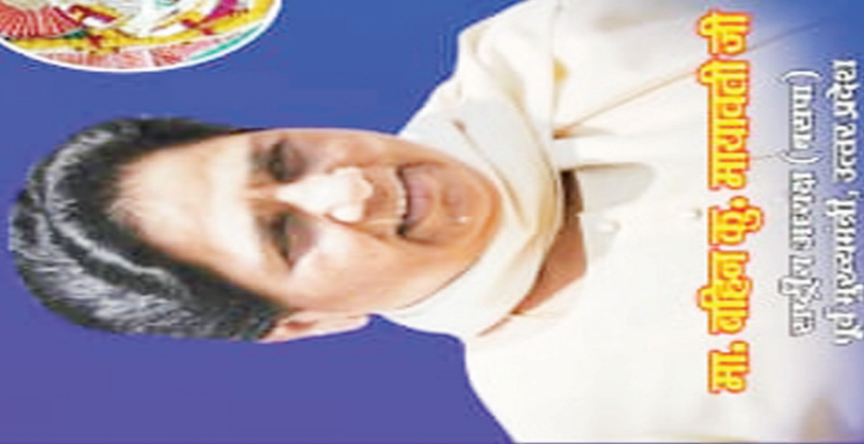
मा. बहिन कु. मायावती जी राष्ट्रीय अध्यक्ष (नरेश) पूर्व मुख्यमंत्री, उत्तर प्रदेश

की समस्त क्षेत्रवासियों को हार्दिक बधाई एवं शुभकामनाएं