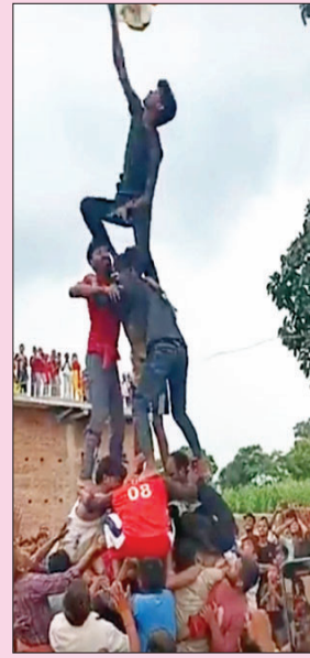
विजेता टीम को मिला 11 हजार का पुरस्कार कार्यक्रम के समापन पर मंदिर कमेटी की ओर से विजेता टीम