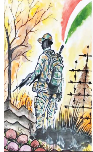
करना भारतीय सैनिक के जोश व समर्पण भाव को दर्शाता है। शीघ्र