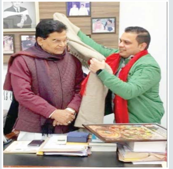
अगर किसी रूप में उनके किसी भी काम आजाए तो बहुत अच्छा है। इस कड़कती सदी में इन गरीबों के दर्द को समझे और उन्हें राहत पहुंचाने के लिए हर संभव प्रयास करें। वितरित