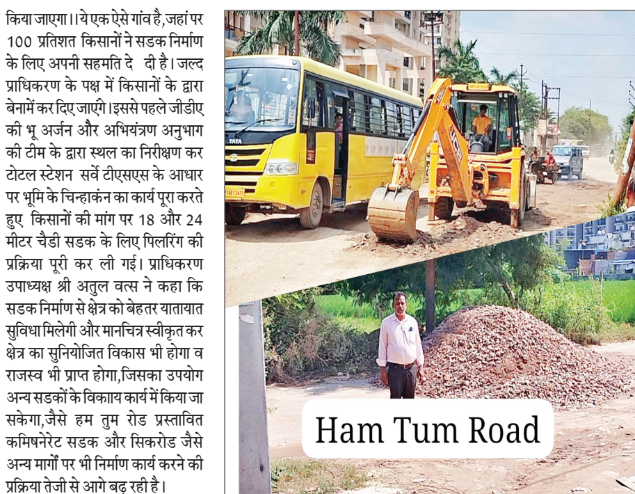
Ham Tum Road