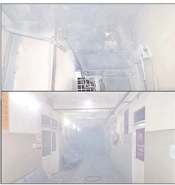
स्टाफ और मरीजों की सांसें अटक गईं। लोग डर के साए में लगातार

सबसे चौंकाने वाली बात यह रही कि आग लगने के बावजूद अस्पताल का फायर अलार्म एक बार भी नहीं बजा, जिससे सुरक्षा इंतजामों की पोल खुल गई। जिस वक्त यह हादसा हुआ, उसी दौरान लेबर रूम में डिलीवरी चल रही थी। वहां मौजूद