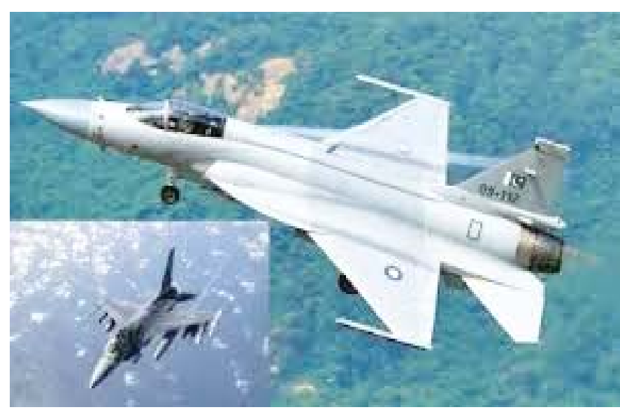
सुपरसोनिक लड़ाकू विमान को भारतीय सतह से हवा में मार करने वाली मिसाइल रक्षा प्रणाली ने मार गिराया। सूत्रों के अनुसार, एफ-16 ने सरगोधा एयर बेस से

नई दिल्ली। पाकिस्तान ने बुधवार रात देश के कई राज्यों पर मिसाइल और ड्रोन से हमले किए। भारतीय एयर डिफेंस ने सभी मिसाइल और ड्रोन को ध्वस्त कर दिया है। पाकिस्तान के नापाक हमलों का भारत जबरदस्त जवाब दे रहा है। भारत ने लाहौर पर कई मिसाइलें दागीं। वहीं, पाकिस्तान का एयर डिफेंस सिस्टम तबाह हो चुका है। लाहौर में वायु रक्षा प्रणाली को भारत ने तबाह कर दिया है। जानकारी के मुताबिक, लाहौर-सियालकोट-कराची और इस्लामाबाद में भी भारतीय सेना की ओर से गोले बरसाए जा रहे हैं। इसी बीच भारत ने जवाबी हमला करते हुए पाकिस्तान पर कई मिसाइलें दाग दी हैं। विदेश मंत्री एस जयशंकर ने अमेरिकी विदेश सचिव मार्को रूबियो से बातचीत की। विदेश मंत्री जयशंकर ने कहा है कि पाकिस्तान के हर हमलों का भारत करारा जवाब देगा। इस बीच, सूत्रों के हवाले से बताया कि शाम को पाकिस्तान वायु सेना के एक एफ-16