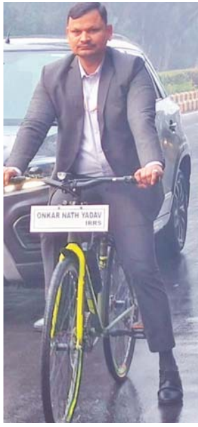
फिट इंडिया पहल को बढ़ावा देने का श्री यादव का यह प्रयास फिट

वायु प्रदूषण को कम करने में मदद मिलेगी, बल्कि फिट और स्वस्थ रहने का संदेश भी व्यापक रूप से फैलेगा। उन्होंने कहा, 'स्वस्थ अधिकारियों को साइकिल से ऑफिस आना-जाना चाहिए। इससे समाज में यह संदेश जाता है कि सरकार अपने नागरिकों के स्वास्थ्य और पर्यावरण को लेकर कितनी गंभीर है। वरिष्ठ अधिकारियों को इस तरह की पहल से समाज के अन्य वर्ग भी प्रेरित होंगे और इस बदलाव का अनुसरण करेंगे।' उन्होंने आगे कहा, 'रलबे समय में एक बड़े परिवर्तन की शुरुआत हमेशा एक छोटे से प्रयास से होती है। साइकिल चलाने की यह पहल न केवल स्वस्थ जीवनशैली को बढ़ावा देती है, बल्कि पर्यावरण को भी संरक्षित करती है। इनके इस विचार से न केवल फिट इंडिया पहल को गति मिलेगी, बल्कि समाज में सकारात्मक बदलाव का मार्ग भी प्रशस्त होगा।'