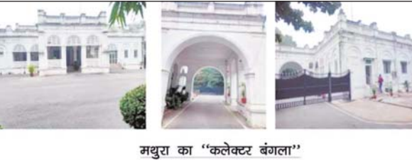
मथुरा का "कलेक्टर बंगला"