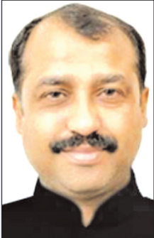
ललित शर्मा संपादक

भारत का चुनाव आयोग उपहास का पात्र नहीं है। उस पर राजनीतिक आरोप चरम करना बेवकूफी है। चुनाव आयोग की भूमिका तटस्थ और निष्पक्ष है, यह विश्व के कई देश सत्यापित कर चुके हैं। वह देश के चुनावों का संचालक है, जो पार्षद-विधायक से मंत्री, मुख्यमंत्री और सांसद से प्रधानमंत्री तक का निर्णायक निर्वाचन तय करता है। चुनाव आयोग काग्रेसी अथवा भाजपाई या वामपंथी नहीं हो सकता। उसके