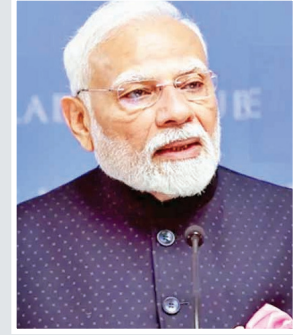
नरेन्द्र मोदी की घाना की पहली द्विपक्षीय यात्रा होगी और वह पिछले तीन दशक में यहाँ आने वाले पहले

प्रधानमंत्री नरेन्द्र मोदी का 9 दिवसीय विदेश दौरा बुधवार से शुरू हो रहा है। इस दौरान वह अफ्रीका और दक्षिण अमेरिका के कई देशों की यात्रा करेंगे। इसके अलावा वह ब्राजील की मेजबानी में हो रहे ब्रिक्स शिखर सम्मेलन में भी शामिल होंगे। सम्मेलन में वह ग्लोबल साउथ से जुड़े मुद्दों को उठाएंगे। आइये जानते हैं उनकी यह यात्रा कैसे ग्लोबल साउथ में भारत की धमक बढ़ाएगी। यह प्रधानमंत्री