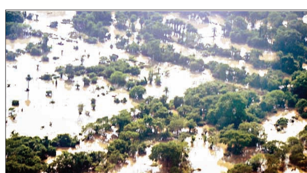
और जलाका नदियों का बढ़ा जलस्तर एक रिपोर्ट के मुताबिक, बालासोर जिले में भारी बारिश और झारखंड से पानी छोड़े जाने के कारण सुवर्णरेखा नदी में बाढ़ आ गई। इसके कारण भोगराई, बलियापाल, जलेश्वर और बस्ता ब्लॉकों के लोग प्रभावित हुए हैं। तीन नदियों- सुवर्णरेखा, बुधबलंग और जलाका का जलस्तर बढ़ने से बालासोर के कई गांवों में बाढ़ आ गई।

बताया कि उत्तरी ओडिशा की सभी बड़ी नदियों का जलस्तर कम हो रहा है, लेकिन बहुत से गांव अभी भी पानी में डूबे हुए हैं। प्रशासन ने बालासोर, मयूरभंज और जाजपुर जिलों में राहत और बचाव काम तेज कर दिया है। सुवर्णरेखा, बुधबलंग